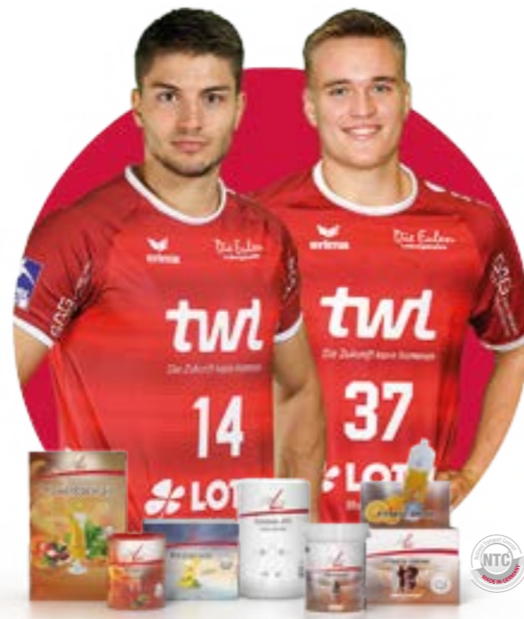
FitLine PowerCocktail; FitLine Activize Oxyplus; FitLine Restorate; FitLine Gelenk-Fit; FitLine ProShape® (Amino); FitLine Fitness-Drink