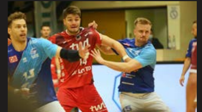
Dessau-Rosslauer HV 06 – Eulen 35:32 (18:15) Beim Dessau Rosslauer HV unterliegen die Eulen 32:35 (15:18). Sie haben die Zweite Liga noch nicht verinnerlicht! Sie sind 48 Minuten ohne Parade.